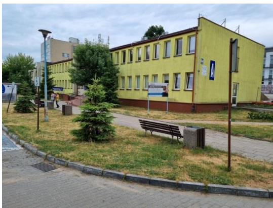
Front obecnego Powiatowego Centrum Zdrowia

Budynek Samodzielnego Publicznego Zespołu Przychodni Specjalistycznych, w której przez ponad 40 lat usytuowana była Przychodnia Kardiologiczna - w przeddzień wyburzenia.